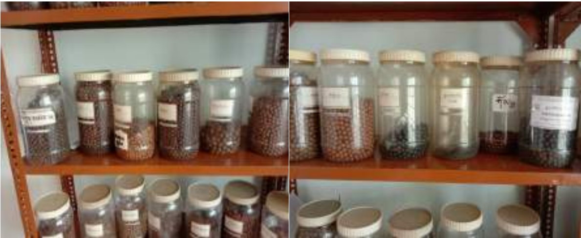
(Image 3 चिकित्सालय में तिब्बती चिकित्सक द्वारा तैयार दवाई, स्थान - तिब्बती कैम्प 01, प्राप्ति दिनांक 16.07.2019)

तिब्बती चिकित्सा पद्धति के अनुसार कभी-कभी कुछ रोगों के इलाज में बाहर से दवा लगायी जाती है, जिसे सीखना बहुत आसान है और इसीलिए आम लोग भी स्वयं ऐसे उपचार अपनाते रहते हैं। तिब्बती चिकित्सा पद्धति के अनुसार बाहर से शरीर पर दवा लगाने के द्वारा शरीर के अन्दर तक उस का प्रभाव डाला जा सकता है। ऐसा उपचार त्वचा के कुछ रोगों, खून निकलने से उत्पन्न कमजोरी व थकावट आदि बहुत से रोगों में उपयोगी साबित होते हैं। इस ऊपरी लेप में जड़ी-बूटियों के पाउडर के साथ-साथ तेलों का भी इस्तेमाल किया जाता है।