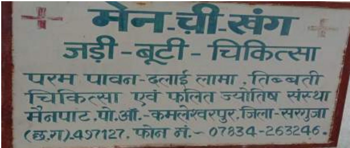
(Image 1 मैनपाट में स्थित जड़ी-बूटी चिकित्सालय का बोर्ड, स्थान तिब्बती कैम्प 01 मैनपाट, प्राप्ति दिनांक 16.07.2019)

मानवजाति चिकित्सा से एक पारंपरिक समाज के सदस्यों की चिकित्सा संबंधी मान्यताओं और प्रक्रियाओं का ज्ञान होता है जो उस क्षेत्र या समाज के सदस्यों के रोगों का निवारण पूर्व काल से उनके पूर्वजों या उस समाज में रहने वाले पारंपरिक चिकित्सक, बैगा, ओझा, समन बैद्य तथा तिब्बती समुदाय में लामा इत्यादि के द्वारा किया जाता है तथा यह कार्य उनके पूर्वजों द्वारा एक पीढ़ी से दूसरे पीढ़ी में हस्तांतरित होते आ रहे हैं। नृजाति चिकित्सा का कोई लिखित विवरण नहीं है लेकिन अनुभव के आधार पर तथा जड़ी-बूटियों, मंत्रों के उच्चारण के ज्ञान के आधार पर इस पद्धति द्वारा उपचार किया जाता है। इन मान्यताओं और प्रक्रियाओं को जानने का प्रयास मानवशास्त्रियों द्वारा लगातार किया जा रहा है। इस प्रकार की चिकित्सा आदिम समाज या विभिन्न पिछड़ी जनजाति, जो जंगलों पहाड़ों में निवास करती है। उनके उपचार के तरीकों में आज भी देखा जा सकता है। अपने पारंपरिक चिकित्सा में देवी देवताओं, तंत्र-मंत्र के साथ-साथ जंगल में विभिन्न प्रकार के जीव-जन्तुओं के अंगों वनस्पतियों जड़ी-बूटियों मिट्टी का उपयोग कर विभिन्न तरह की बीमारियों आदि का उपचार करते हैं।